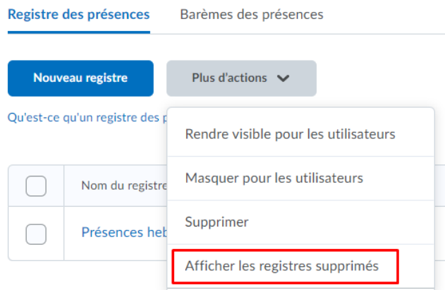
Figure 2. Le menu Plus d'actions avec la fonctionnalité Afficher les registres supprimés .