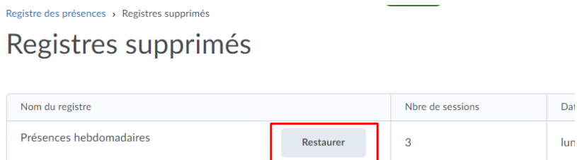
Figure 3. La fonction Restaurer pour le registre des présences