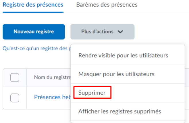
Figure 1. Le Registre des présences avec le menu Plus d'actions et la fonctionnalité Supprimer .